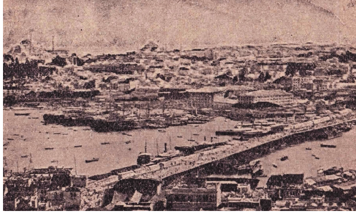
Resim-3: İstanbul Şehri

Balkan Savaşlarının Osmanlı zihniyet dünyasında yarattığı karmaşa eserdeki tek haritaya yansımıştır. Sayfa 11'deki "Esir Vatan" alt başlıklı haritada Balkanların haritası verilmiştir. 59 Haritada dört temel yer adı ile karşılaşmaktayız. Bunlar: Küçük Asya, Rumeli, Bulgaristan ve Sırbistan'dır. Küçük Asya'nın İzmir ile Kırklareli kentleri arasında kalan temel kentler, Bulgaristan ve Rumeli'nin hemen hemen bütün önemli kentleri, Sırbistan'ın ise Niş kenti haritada yer almaktadır. Rumeli toprakları koyu renk ile gösterilerek farklı bir konuma taşınmış, vatan parçası olarak tanımlanmıştır. Ayrıca Rumeli haricinde şehir adlarının yakınına içi dolu daireler ya da yıldızlar yerleştirilmiştir. Bu daire ve yıldızların işlevi konusunda bir açıklama yapılmamıştır. O yüzden ne anlama geldikleri tam olarak çıkartılamamaktadır.